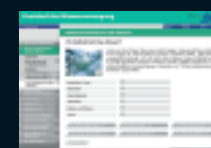
«Screenshots» Trainingssoftware «Kreislauf der Wasserversorgung».