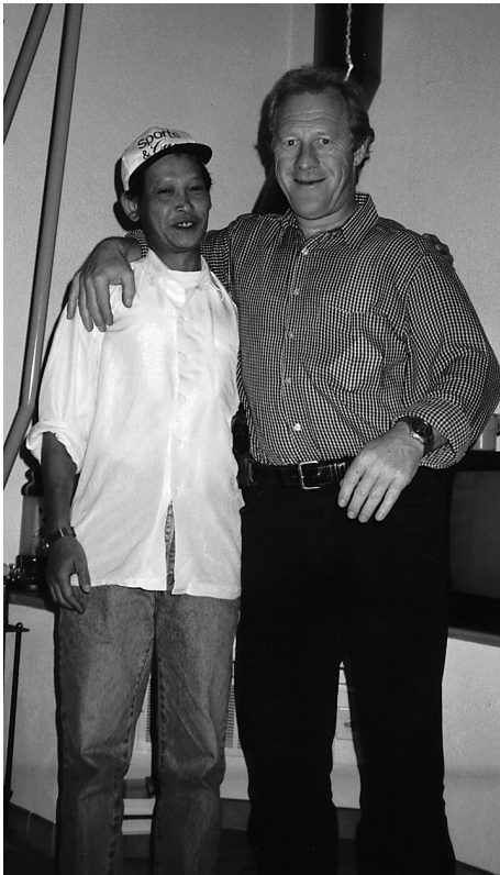
Wer ist mein Nächster?

Es fällt auf, wie einfach dieses Gesetz eigentlich ist: Wir müssen unser ganzes Leben auf Gott ausrichten, auf das, was letztlich wesentlich ist. «Gott ist das, was