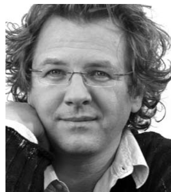
Andreas Fröhlich Recherchen und Archiv: Bob Andrews

Viel Spass mit den drei Fragezeichen wünscht Thomas Hintermann!!!